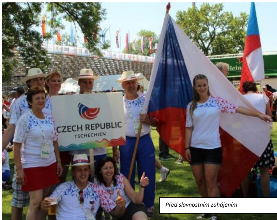
Před slavnostním zahájením

V mezičase, když jsme necvičili, jsme mohli obdivovat krásy okolní přírody a to nejen dole, u Bodamského jezera, ale i při túrách po horách čnicích se nad jezerem či při nenáročných procházkách v soutěskách mezi skalami.