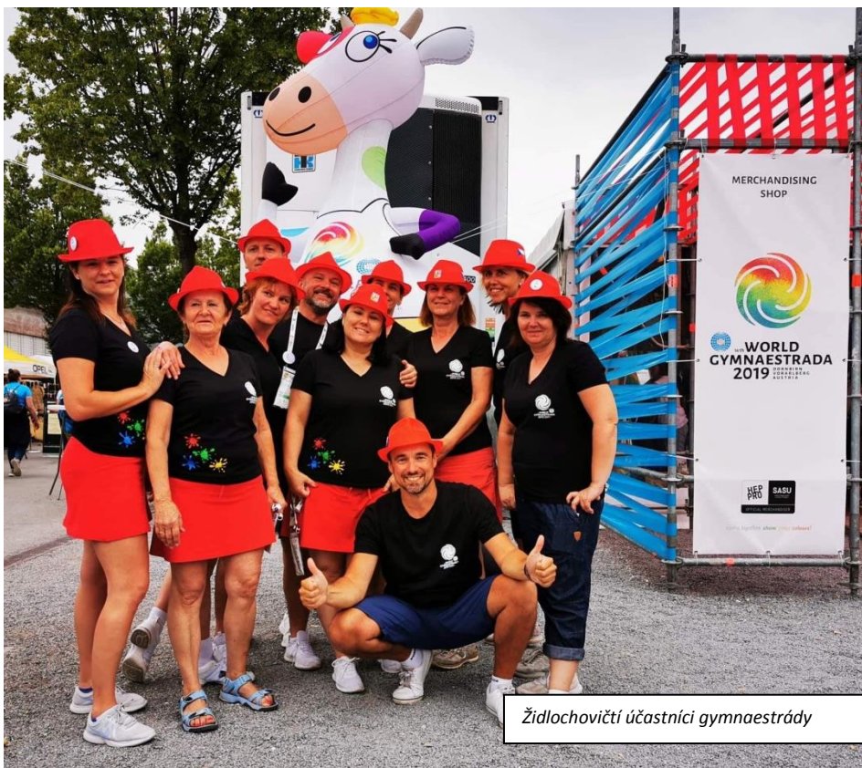
Židlochovičtí účastníci gymnestrády

Jako vždy zde panovala neskutečná a nepopsatelná atmosféra soudržnosti, bez ohledu na pohlaví, věk, rasu, náboženství, kulturu, schopnosti nebo společenské postavení. Kromě tradičních účastnických zemí se zde představilo také 13 nováčků: Arménie, Barbadosu, Kolumbie, Fidži, Malty, Malawi, Mozambiku, Nepálu, Paraguaye, Srbska a Tongy, spolu s Keňou a Tanzánií, které se zúčastnily jen jako pozorovatelé. Celkem se zde sešlo téměř 18,5 tisíce lidí z 66 zemí 5 kontinentů. A to ne ledajakých lidí, ale sportovců - gymnastů, kde v každém z nich je více či méně chuti se předvádět a bavit nejen sebe, ale i všechny kolem. A když si k tomu přimyslíte to množství endorfinu, které se nám při cvičení do těla vyplaví, tak věřte tomu, že za celý týden nepotkáte žádného smutného nebo našťavaného člověka.