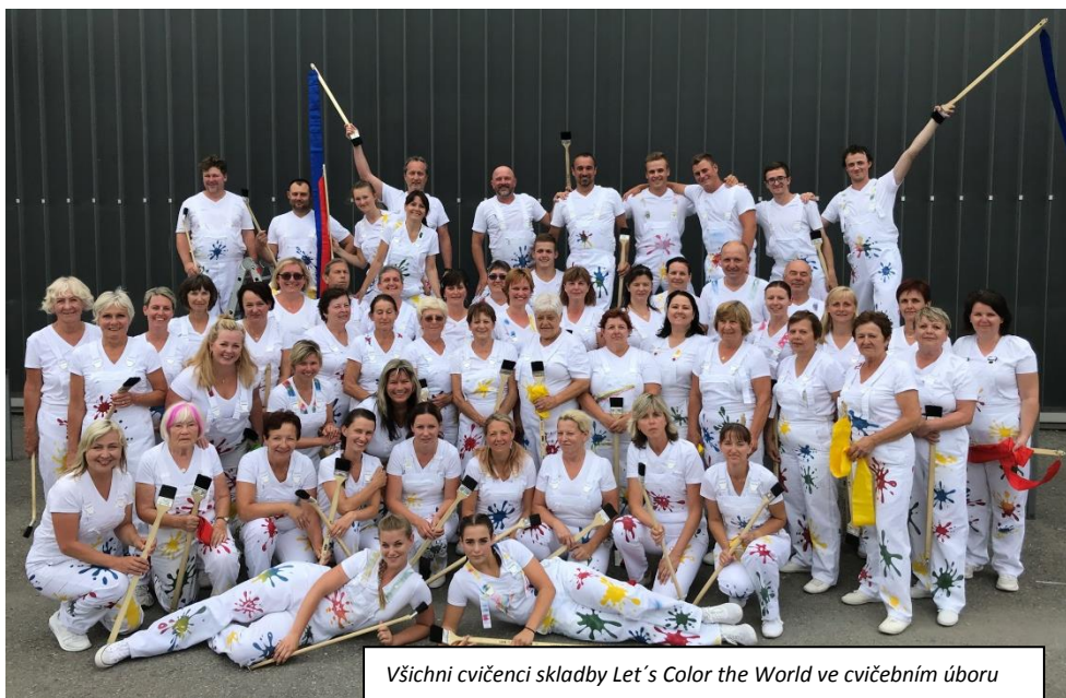
Všichni cvičenci skladby Let's Color the World ve cvičebním úboru