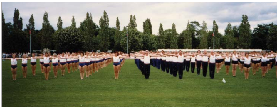
Snímek z památného mezinárodního sokolského vystoupení na sletovém cvičišti v Paříži.