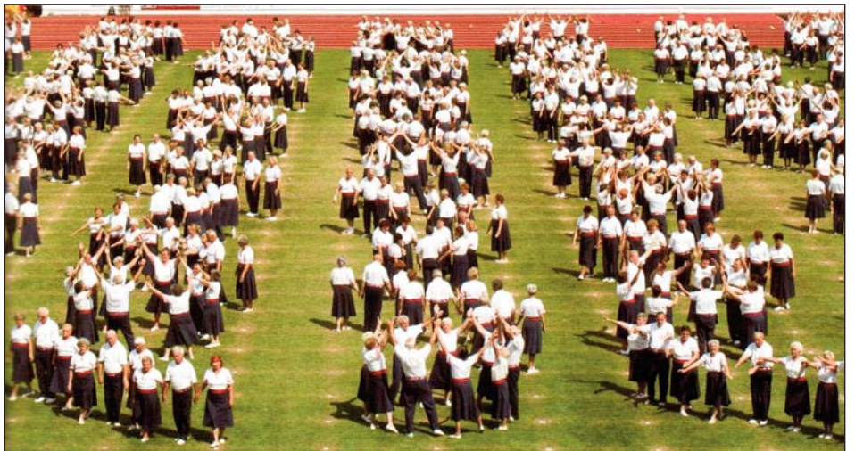
Vystoupení Věrné gardy přináší pěkné zážitky cvičencům i divákům. Tuto skutečnost jistě potvrdí i červené Sokolské Brno 2010.

Doprava do Trenčína (asi 150 km) individuálně, ubytování na lůžku v internátě (5,5 až 13,30 eur) a ve školních třídách a tělocvičnách s vlastní výbavou (podložka, deka, spacák – cca 2 eura na osobu a noc). Strava – plná penze 8,5 euro, sletový odznak 5 eur (každý účastník). Bližší informace v župní kanceláři, tel. 541 213 240.