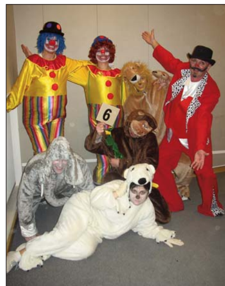
Cirkus Bumberto měl v Židlochovicích sokolovně úspěch.