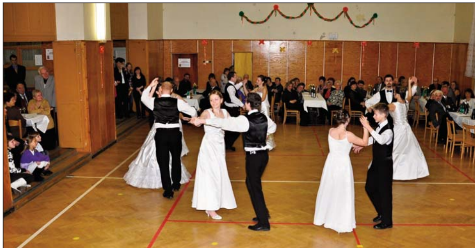
MLADÍ TANEČNÍCI ZE SOKOLA SILŮVKY PŘIPRAVILI NÁVŠTĚVNÍKŮM ŽUPNÍHO REPREZENTAČNÍHO PLESU NÁDHERNÉ ZÁŽITKY.